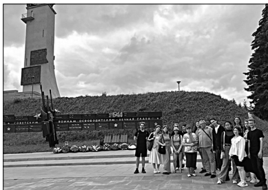
Екатерининская горка мемориал Советским-воинам освободителям.