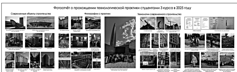
4. Фотодокумент о прохождении технологической практики студентов 3 курса 2025 года