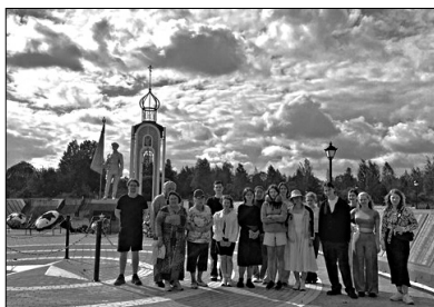
Долина смерти близ деревни Мясной бор (Мемориальный комплекс).