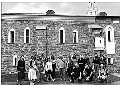
Великий Новгород (акцент на вековую кладку кирпича).